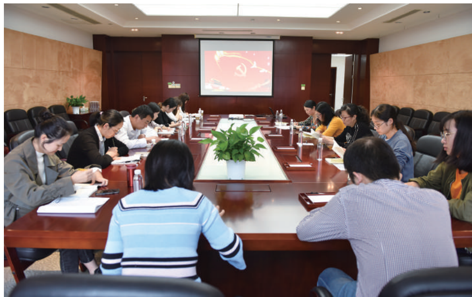
(全面) 班党支部等也开展了主题教育集中学习研讨。

此外,行政管理职员第一党支部、丝路学院教职工党支部、管理职员与本科学生联合党支部、2018级金融硕士(计量)班党支部、2018级金融硕士