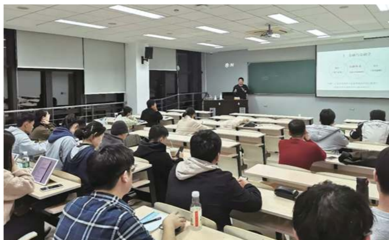
中美项目学生参加南京大学林辉教授讲座《资本市场的创新与发展》

在系列讲座开设方面,中美项目注重学生分析能力和创造性解决实际问题的能力培养,突出现场研究、模拟训练等方法,鼓励学生“走出去”,积极参与基础课程之外的金融系列讲座。本学期,已经陆续开设了《资本市场的创新与发展》《对冲基金策略》《数字货币》等多场讲座。