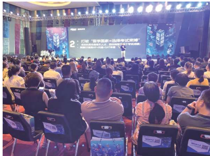
参加2021年新东方全国留学展

为了拓展生源渠道,扩大项目宣传范围,提升项目知名度,精准把握留学市场的动向和趋势,中美项目主动联系合作留学机构,持续筛选并扩充留学机构合作储备库,建立合作单位103家。通过线下合作洽谈、线上会议培训、参加留学活动与教育展等方式,与留学机构建立了紧密联系。