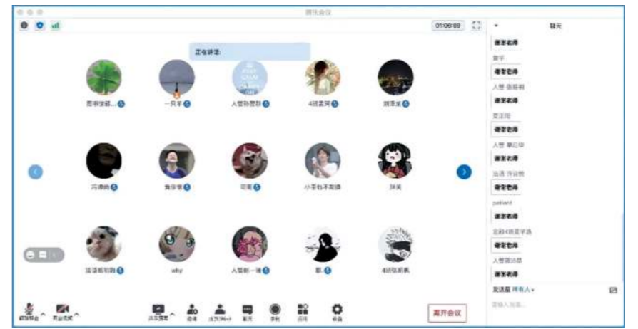
中法学院线上新生入馆教育培训

9月9日至30日，图书馆分别针对中法学院、国际学院、丝路学院新生，共完成了三场线上新生入馆教育培训。为提升线上培训效果，图书馆多次调整培训内容，精心演练，并制作系列入馆培训小视频，通过PPT演示讲解及视频展示等直观方式，为新同学全面介绍了图书馆资源、图书馆服务、图书馆利用等内容，引导同学更快熟悉图书馆借阅规则、自助设备使用方法，帮助同学高效利用图书馆资源、享受馆内便捷服务。