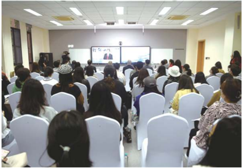
中国人民大学校长刘伟发表视频致辞。

11月6日至7日,由教育部中外语言交流合作中心和中国人民大学共同主办的第七届世界汉学大会召开。