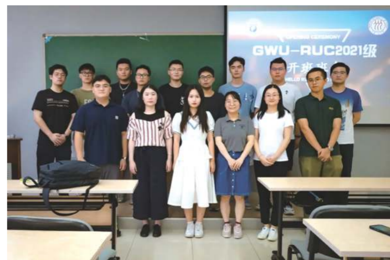
中美项目2021级开班班会

十年来,中美项目累计培养学生数量444名,开设专业从单一金融硕士专业增加到金融、项目管理、商业分析三个专业,生源结构从以国内高校本科生为主发展到以国内和海外高校本科生基本一致,学生来源从以北京为主扩大到目前国内25个省市近50个城市,以及美国、加拿大、英国等国家。在新的十年的起点,中美项目将强化品牌效应,继续为学生提供多样的商科申请选择,不断提升项目的国际化水平和人才培养质量。