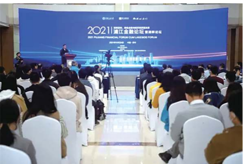
中美项目学生参与2021浦江金融论坛

当前经济全球化、金融数字化对全球金融体系的发展带来了深远影响,同时也对金融人才提出了更高的要求,学生未来需要运用金融学科理论、知识和方法来分析、解决工程金融实际问题。中美项目积极鼓励学生参与校区举办的