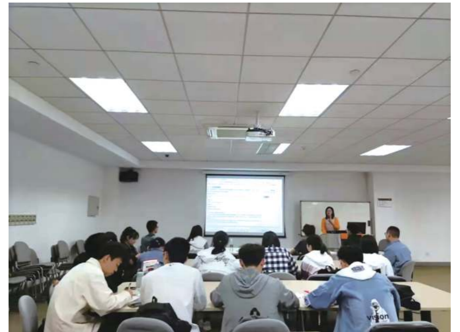
新生研讨课图书馆资源利用培训

为将信息素养教育做深做细，校区图书馆经过上学期的初步探索，在本学期积极与新生研讨课教师合作，将信息素养教育嵌入到新生研讨课中，面向同学开展资源利用专题培训。一改传统大班讲授方式，培训以各专业班级小班为单位，针对学生不同的专业背景，量身设计了不同专题的文献资源检索利用培训课程，为新同学更加准确地获取专业文献信息资料提供了一把“金钥匙”。