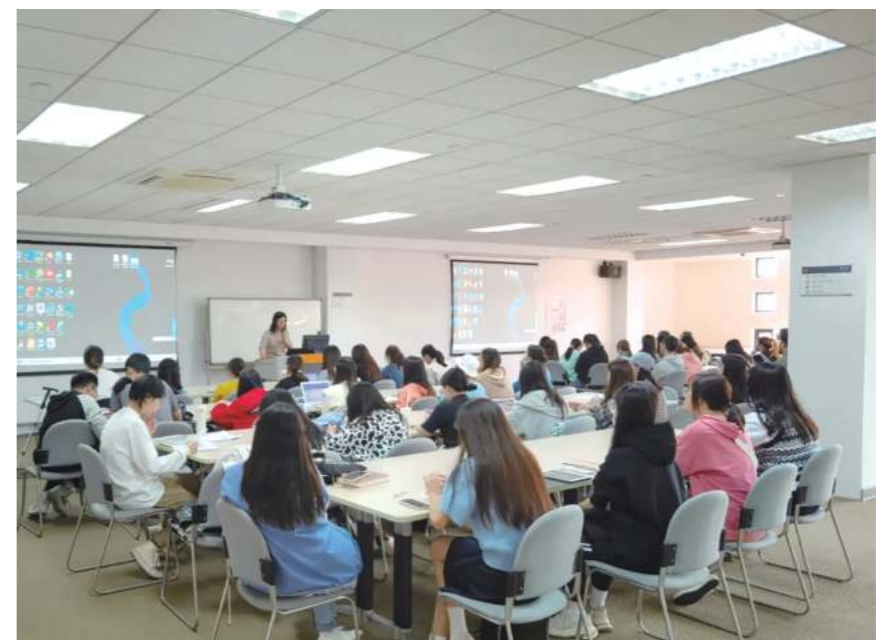
汉教类资源检索培训

本学期，图书馆特别针对新生开设了《常用信息检索技术介绍》《Caim数据库使用介绍》《汉教类资源获取》《经济类资源检索》《常用办公软件系列培训》等多个专题培训，帮助同学提升了专业文献获取技能和办公软件操作技能。其中《汉教类资源获取》专题培训为2021级汉语国际教育专业硕士讲解其专业相关的图书、期刊、学位论文等类型文献的检索及获取方法，提供了更多文献获取途径，同学们听讲热情高，课后开展积极交流，培训效果显著。