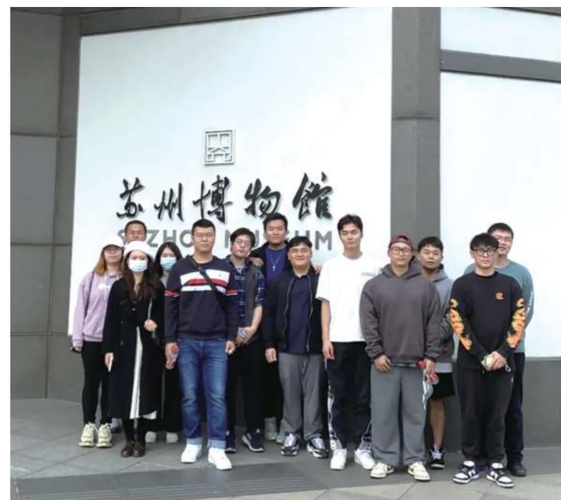
中美项目学生参观苏州博物馆

在学生课外文体活动和人文关怀方面,中美项目一方面积极鼓励学生融入校区活动,另一方面充分利用苏州校区所在独墅湖科教创新区的区位优势 and 苏州现代化的发展成果及丰厚的历史人文资源,组织开展了丰富的学生活动,为学生第一阶段的配套学习生活加上浓墨重彩的一笔。近年来,中美项目学生斩获了校区趣味运动会一等奖、篮球比赛冠军、足球比赛冠军、台球争霸赛冠军等多项荣誉,提升了学生的参与度和归属感。