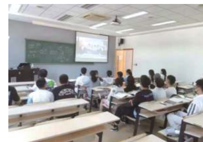
图5：2021级国民经济管理班集中观看纪念辛亥革命110周年大会