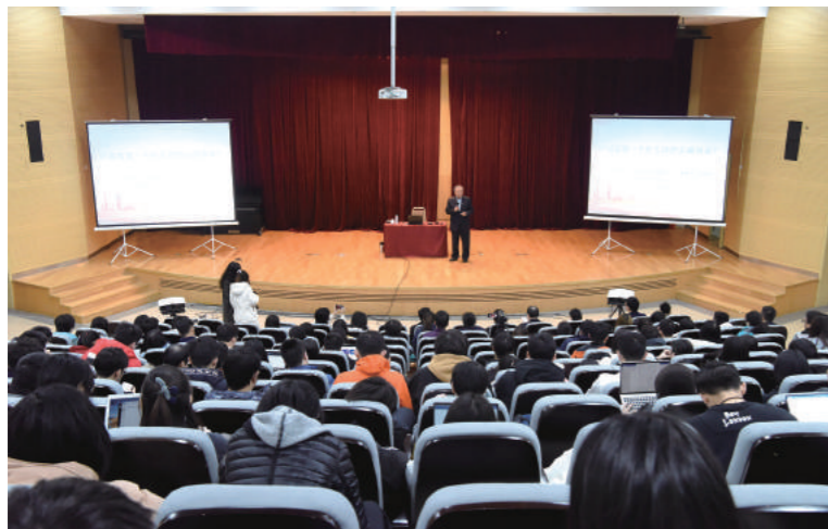
12月19日下午，苏州校区邀请我国著名经济学家、中国人民大学金融学一级教授、中国人民大学前副校长吴晓球教授为师生做题为“中国需要怎样的金融体系”的